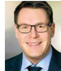
Dr. André Geßner Fraunhofer IAP